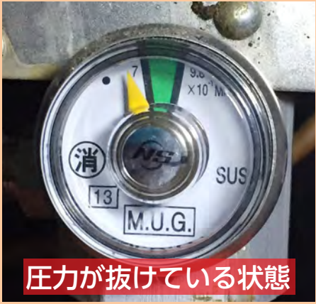
圧力が抜けている状態