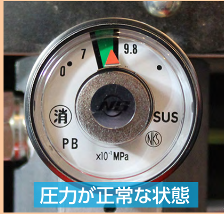
圧力が正常な状態