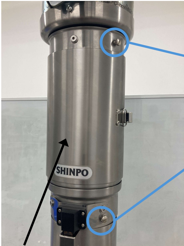
フィルタボックス